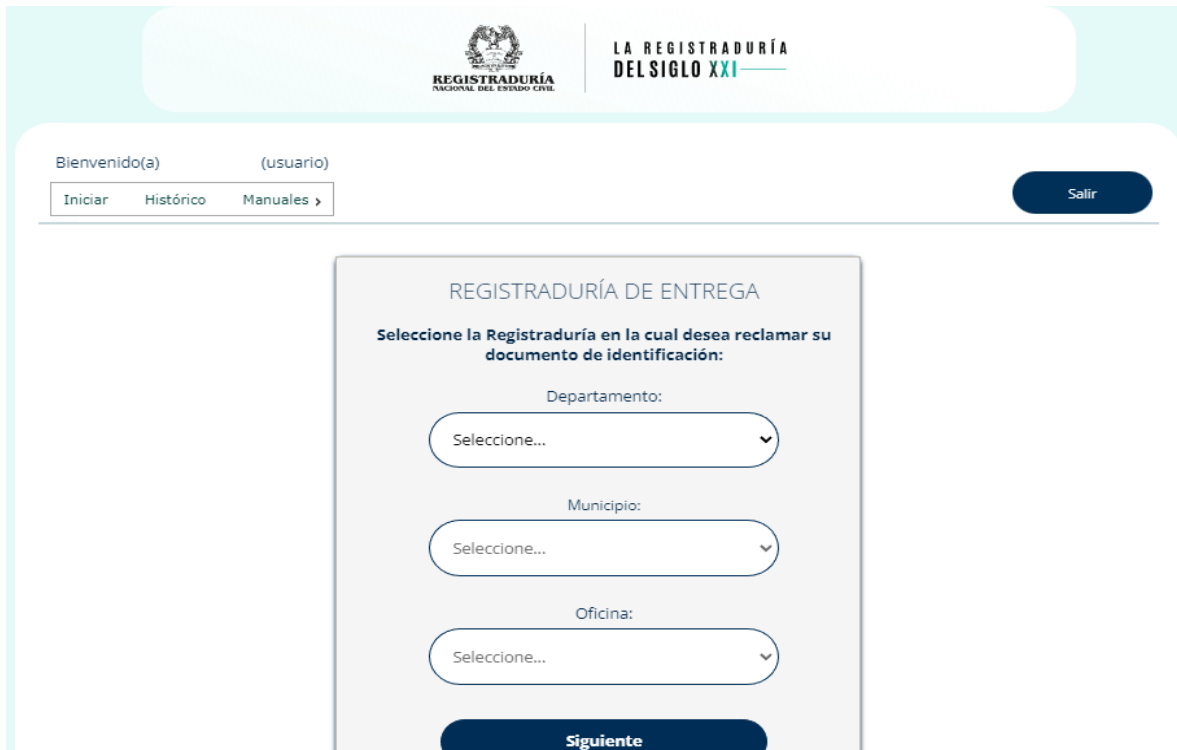
ILUSTRACIÓN 12. REGISTRADURÍA DE ENTREGA

Deberá seleccionar la Registraduría donde desea reclamar el duplicado del documento de identidad: