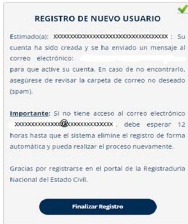
ILUSTRACIÓN 4. MENSAJE DE REGISTRO DE NUEVO USUARIO

Luego de que los datos sean registrados y validados por el sistema le aparecerá el siguiente mensaje: