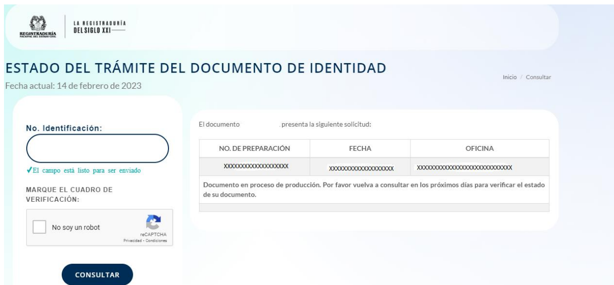
ILUSTRACIÓN 22. ESTADO DEL TRÁMITE DEL DOCUMENTO DE IDENTIDAD

Puede consultar el estado del trámite de su documento de identidad en la página principal de la Registraduría Nacional del Estado Civil https://www.registraduria.gov.co o desde el enlace directo: https://wsp.registraduria.gov.co/estadodocs/ ingresando el número de identificación: