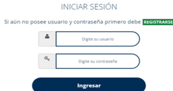
ILUSTRACIÓN 6. INICIAR SESIÓN

Podrá iniciar sesión con las credenciales de acceso, usuario (número de identificación) y contraseña, enviadas a la dirección de correo electrónico registrada: