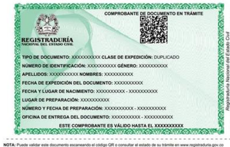
ILUSTRACIÓN 20. COMPROBANTE DE DOCUMENTO EN TRÁMITE

El comprobante de documento en trámite para reclamar el documento de identidad será enviado a la dirección de correo electrónico registrada al momento de realizar la solicitud en línea o la puede descargar desde el aplicativo web en el menú “HISTÓRICO” luego de 24 horas de haber realizado la transacción con estado aprobada.