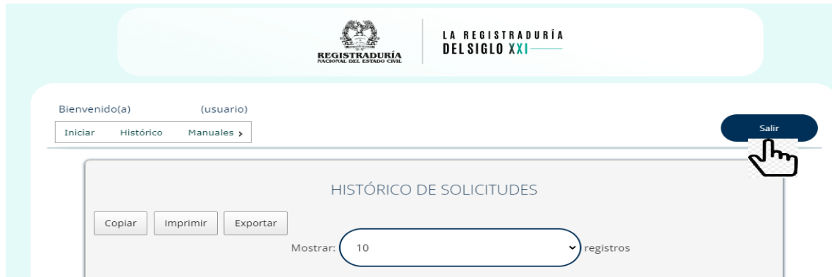
ILUSTRACIÓN 21. CERRAR SESIÓN

Por seguridad al finalizar la operación deberá cerrar la sesión.