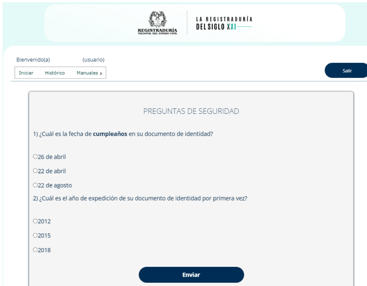
ILUSTRACIÓN 11. PREGUNTAS DE SEGURIDAD

Deberá responder las preguntas de seguridad: